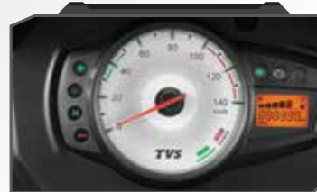
इकोमीटर के साथ मल्टी-फंक्शन कन्सोल