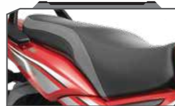
प्रीमियम ड्युअल टोन सीट