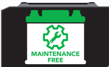
मेंटेनेंस फ्री बैटरी