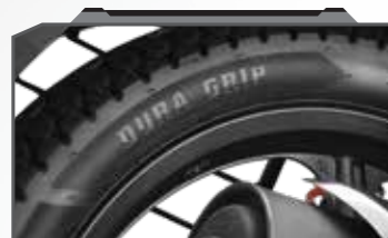
ड्यूरा ग्रिप टायर्स