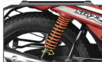
5-स्टेप एडजस्टेबल शॉक एब्जॉर्बर