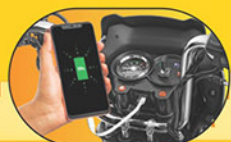
ಮೋಬೈಲ್ ಚಾರ್ಜರ್ A