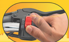
ಅಜ್ಜಿ ಆನ್-ಆಫ್ ಸ್ವಿಚ್