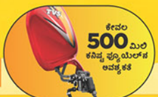
ಕೇವಲ 500 ಮಿಲಿ ಕನಿಷ್ಠ ಫ್ಯೂಯಿಲ್‌ನಲ್ಲಿ ಅವಶ್ಯಕತೆ