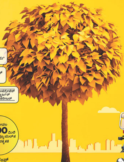
ಕೂಲ್ ಮಿಂಟ್ ಬ್ಲೂ