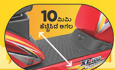
10 ಮಿಮಿ ಹೆಚ್ಚಿನ ಅಗಲ ದೊಡ್ಡ ಪ್ಲಾಟ್‌ಫಾರ್ಮ್