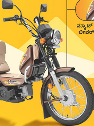
XL100 HEAVY DUTY