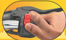
ఈజి ఆన్-ఆఫ్ స్విచ్