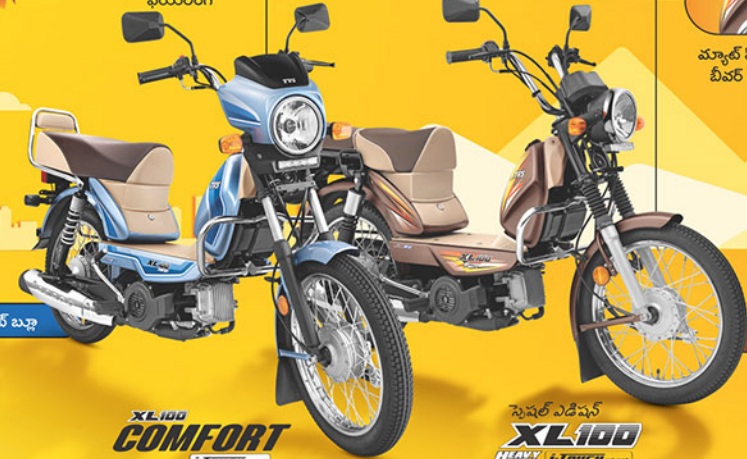
కూల్ మింట్ బ్లూ