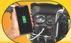
మొబైల్ ఛార్జర్ 1