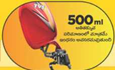
ఎక్స్ట్రా డ్రై పంప్