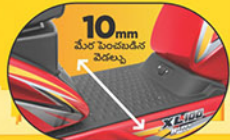
పెద్ద ఫ్లోట్ ఫామ్